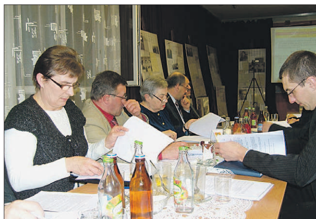
Radni dobczyccy zatwierdzili podwyżkę cen wody i ścieków