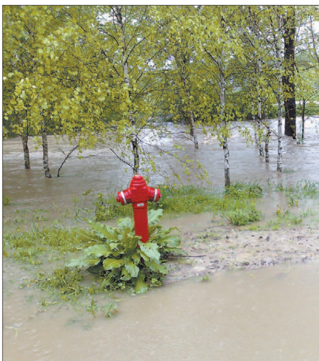
Przy wariancie I pojawi się problem odwodnieniowy. Wolanie boją się go, bo w br. wioska zalewana była już siedem razy.

Wolanie jednak uważają, że konsultacje powinny być oddzielne. Oni licznie uczestniczą